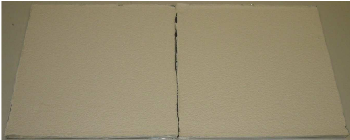
A003: Klima KP 36 W