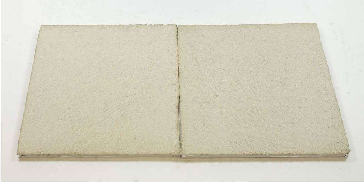
A008: SelfporSanierputz SP 64 P